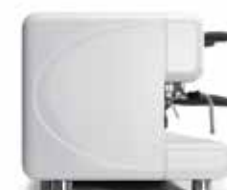
bianco lucido glossy white