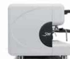
bianco satinato satin white