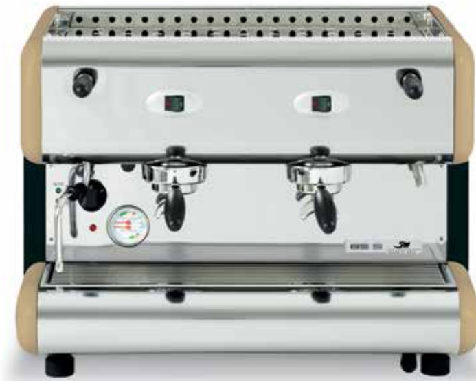
85-S 2gr. Sprint