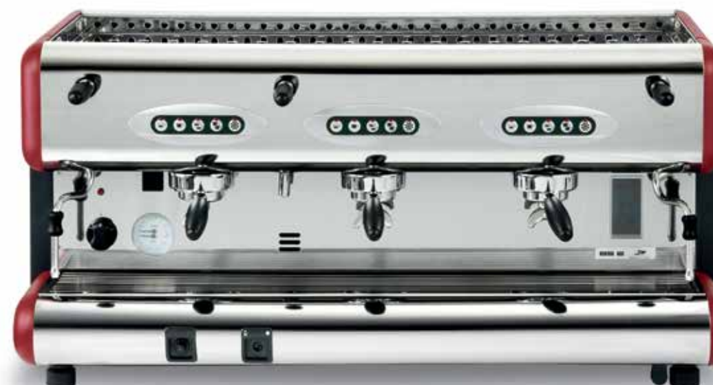
85-E 3gr. gas