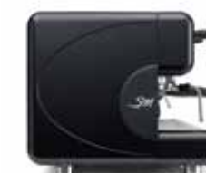
nero dark dark black