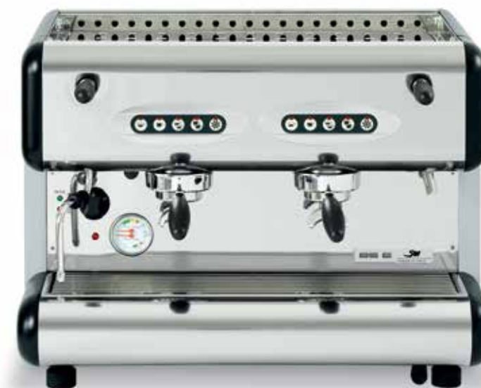
85-E 2gr. Sprint

"E" e 2 modelli Sprint "S"- da 5 e 10 litri e misure contenute rispetto alla versione standard 2 gruppi da 12 litri caldaia.