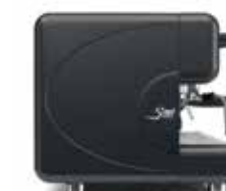
nero opaco matt black